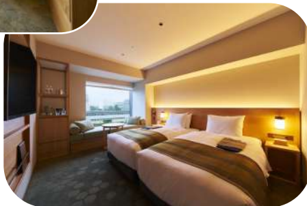
スーパーアツイン 【富士山ビュー】